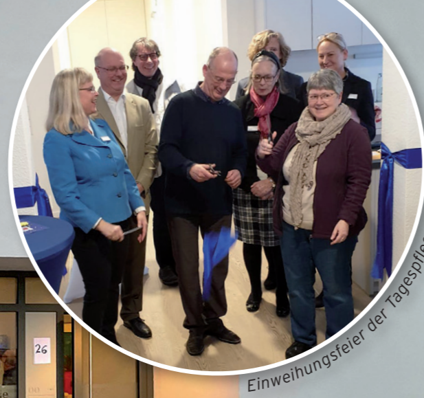
Einweihungsfeier der Tagespflege