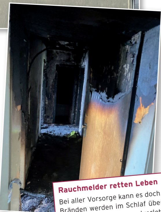
Wohnungsbrand Am Rapohl